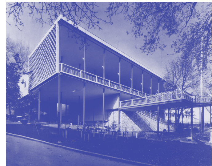
Pavillon japonais de 1937 de Junzo Sakakura lors de l'exposition internationale de Paris.

Dans le contexte d'une pratique architecturale mondialisée, il faut espérer que nos pratiques continuent à constituer des ressources pour celles au Japon et inversement. Ainsi elles ne s'opposent pas nécessairement mais s'échangent et s'enrichissent. Un voyage au Japon est une des meilleures opportunités de faire l'expérience qu'une autre spatialité est possible.