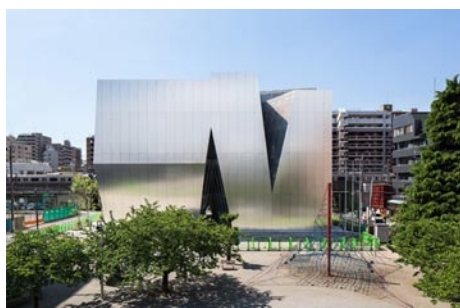
Sumida Hokusai Museum (Sanaa)