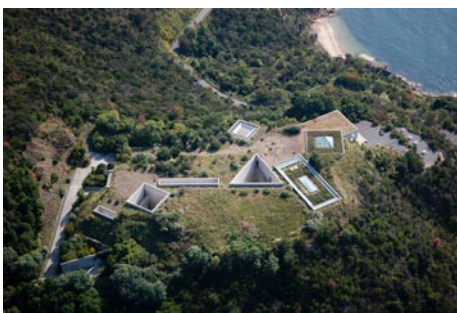
Benesse Museum (Tadao Ando)