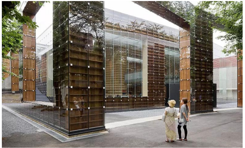
Musashino Art University (Sou Fujimoto)