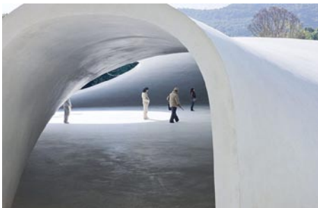
Teshima Art Museum (Ryue Nishizawa)