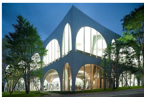
Tama Art Institute (Toyo Ito)