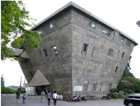
Seminar house (T. Yoshizaka)