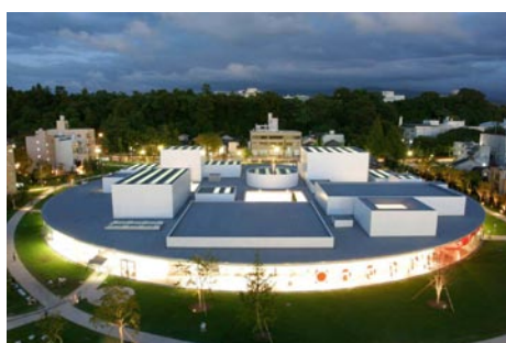
Musée du 21 ème siècle (Sanaa)