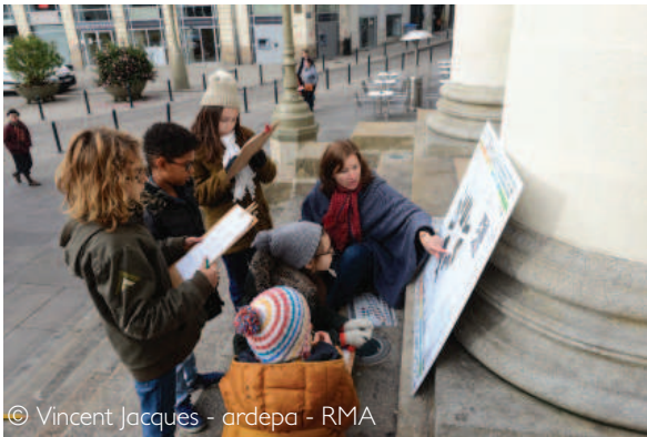
© Vincent Jacques - ardepa - RMA