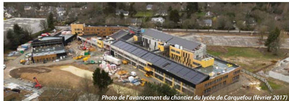
Photo de l'avancement du chantier du lycée de Carquefou (février 2017)

mise en œuvre grâce à l'utilisation conjointe du bois et du solaire, c'est le bâtiment lui-même qui offre, pour les futurs 900 lycéens, un cadre de vie accueillant, mêlant façades de bois traversées d'arborescences et volumes colorés, lisses et réfléchissants. Ces deux établissements proposent une mise en scène urbaine inédite où les parvis offrent des accroches urbaines empreintes de générosité et de plaisir pour les collégiens et les lycéens tout en témoignant de la volonté de « Bien Vivre Ensemble ».