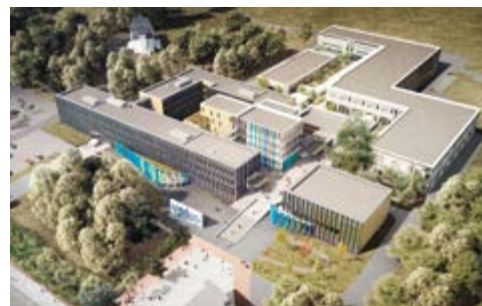
Le nouveau parvis central, In Situ Architecture & Environnement

Le concours « Nouveau Tertre » est lancé en 2013. Il concerne la scolarité générale, les services administratifs, le service informatique, quatre UFR (Histoire/Archéologie, Sociologie, Psychologie, IRFLE) et le restaurant universitaire.