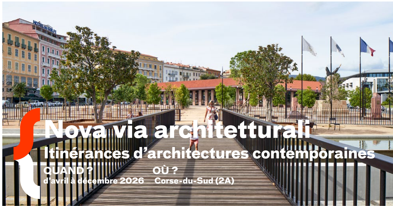
Aménagement de la place Campinchi et réalisation de la halle de marché - Ajaccio - 2021 © Bernard DESMOULIN en association avec ORMA Architectura © Michel Denance