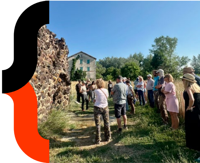
MA Auvergne - Réenchantons les thermes de St Marguerite - St Maurice - 2025

Ce sixième programme de résidences a lieu grâce aux engagements fidèles et aux partenariats avec la Caisse des Dépôts, le ministère de la Culture et de l'Ordre des Architectes. Nous les remercions tous les trois.