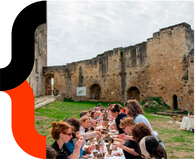
308MA - Terre nourricière - Rauzan - 2025

Afin de permettre à tous de suivre le déroulement des résidences, chaque équipe créera et alimentera un site/blog dédié à la résidence et pourra produire un support de synthèse présentant leur démarche et leurs réalisations.