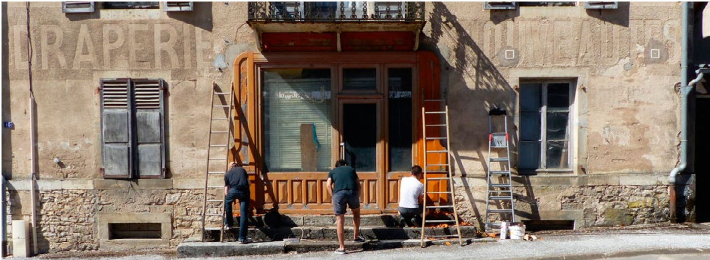
MA Franche-Comté - Office des utopies - 2022