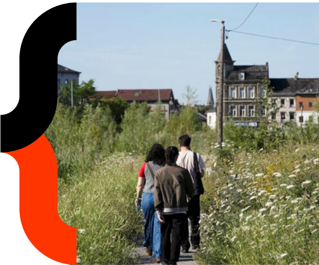
MA Hauts-de-France - Friches en miroir - 2025

L'équipe qui les entoure peut être à géométrie et professions variables, offrant ainsi des points de vue et des méthodes de travail variés et complémentaires .