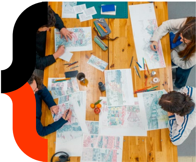
Territoires pionniers - Bassin de Caen, quels futurs - 2025

Des formats expérimentaux court ou long en collectif ou en binôme, en itinérance.